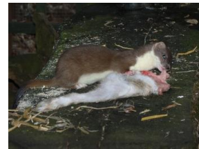
Auch wenn Kaninchen scheinbar grösser sind, gehören sie zu ihrer Beute.