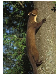
Marder sind extrem geschickte Kletterer und Akrobaten. Sie können auch durch kleinste Öffnungen gelangen.