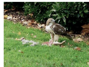
Greifvögel kommen auch bei uns vor. Netze halten sie nicht auf.